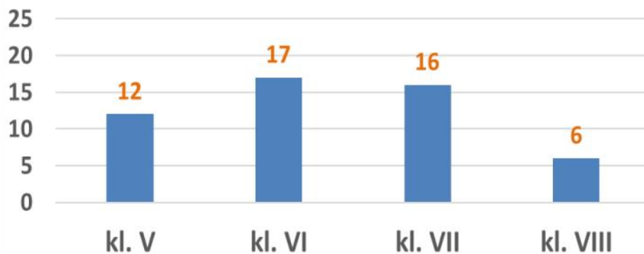
Liczba FINALISTÓW konkursu MŁODY MATEMATYK 2024 R.

W roku szkolnym 2023/24 konkurs „Młody Matematyk” odbył się po raz dwudziesty drugi. Głównym celem konkursu jest rozwijanie uzdolnień matematycznych wśród młodych pasjonatów, ukazywanie piękna matematyki, popularyzowanie jej, ale również pomoc w przygotowaniu do innych konkursów matematycznych (np. Olimpiada Matematyczna Juniorów). W konkursie biorą udział uczniowie z klas V- VIII szkół podstawowych. Składa się z trzech etapów. Pierwsze dwa etapy szkolne są równorzędne. Przystępują do nich wszyscy uczestnicy rozpoczynający zmagania, zbierając i sumując zdobyte w dwóch podejściach punkty. Najlepsi z nich, wyłonieni przez komisję konkursową, przystępują do finału. W bieżącym roku szkolnym do konkursu zgłosiło się 25 szkół podstawowych: 19 szkół z powiatu mławskiego i 6 szkół z powiatu żuromińskiego. Do finału zakwalifikowało się 51 uczniów z 18 szkół.