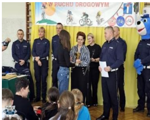
45 Turniej Bezpieczeństwa w Ruchu Drogowym