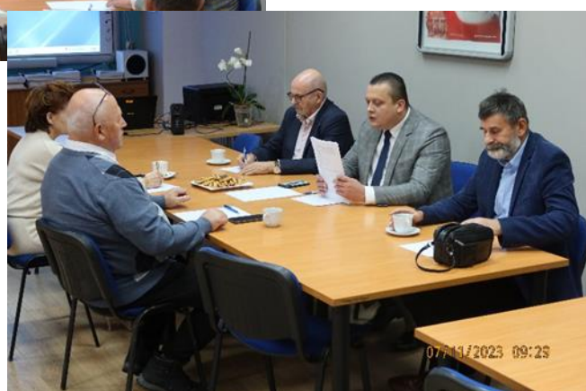
Podsumowanie Powiatowego Konkursu Historycznego im. prof. Ryszarda Juskiewicza – „Wojna obronna Polski w 1939 roku. Wrzesień 1939 roku na Mazowszu Północnym. Bitwa pod Mławą”.