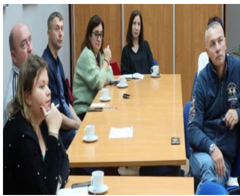
Nauczyciele Edukacji dla bezpieczeństwa