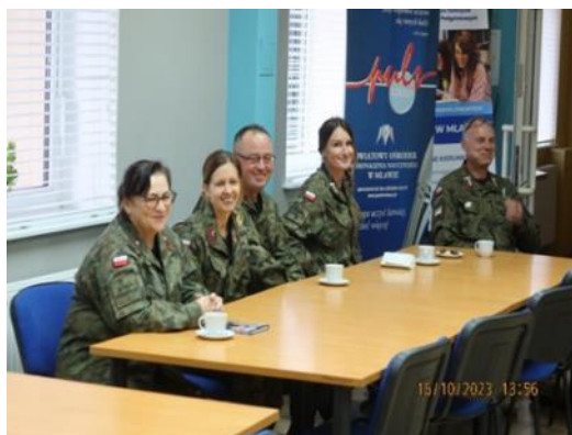
Przedstawiciele Jednostki Strzeleckiej 1863 Unieck im. Powstańców Styczniowych